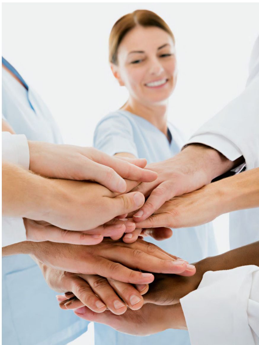
Si les paliers de développement personnel sont atteints, l'employé peut affirmer tout son potentiel et s'épanouir dans son activité professionnelle.

Si et seulement si les quatre premiers paliers de développement personnel sont